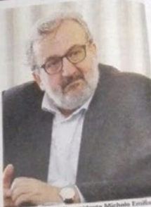
REGIONE PUGLIA Il presidente Michele Emiliano