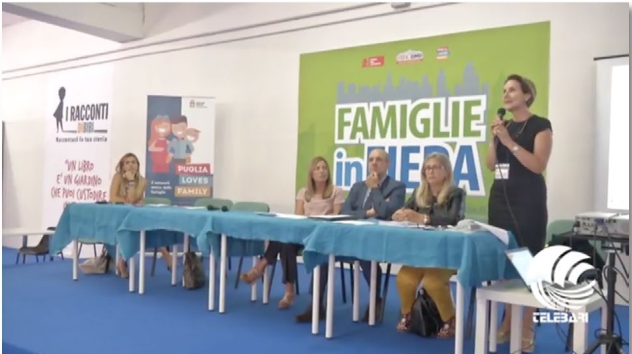
dal minuto 6:52 al minuto 8:34